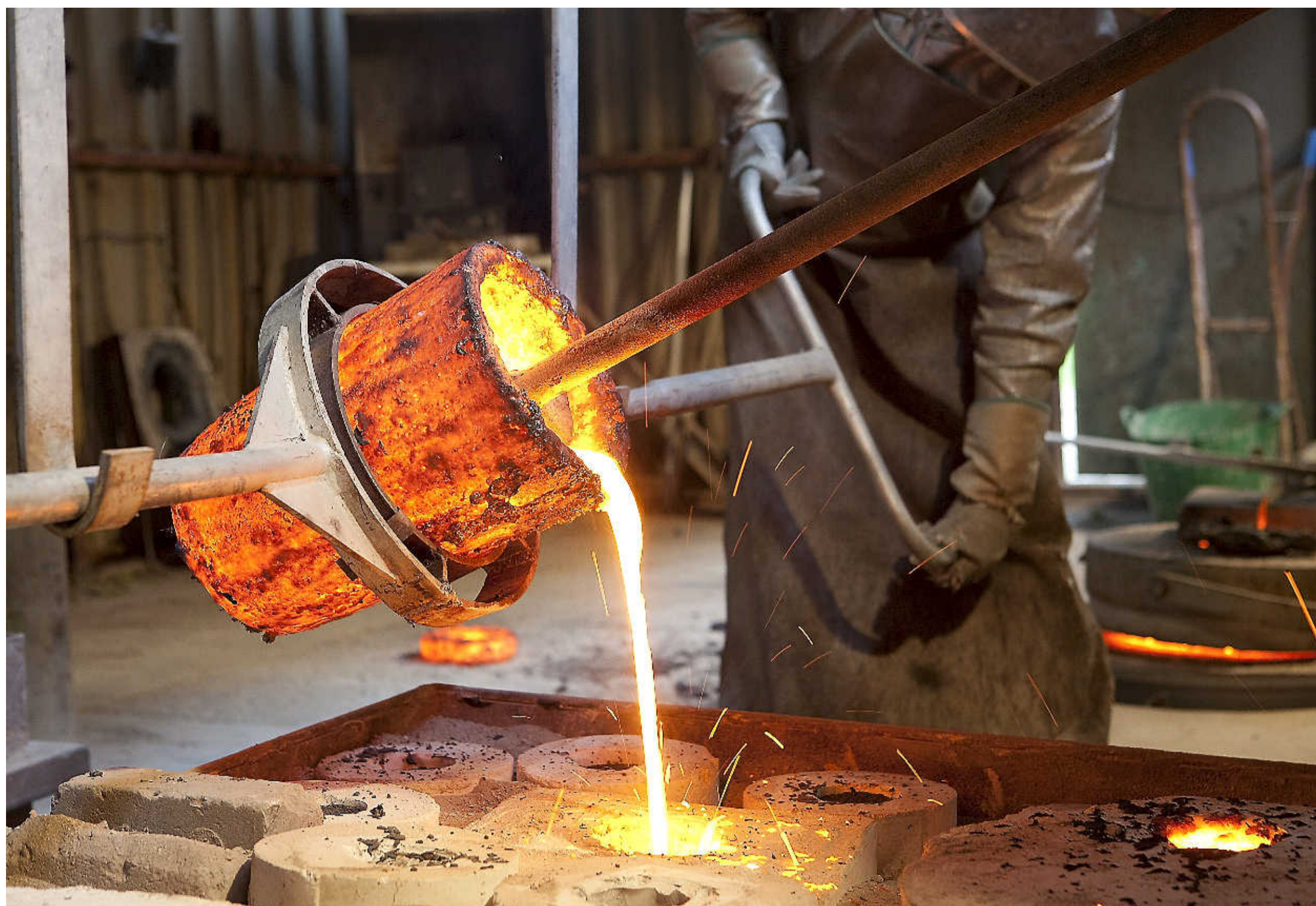
Kunst in wording.