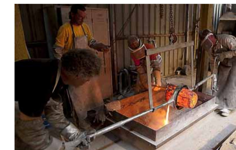
Concentratie bij het gietteam.