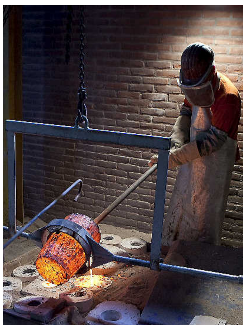
Bronslava vult de holte die is gevormd nadat de was is gesmolten.