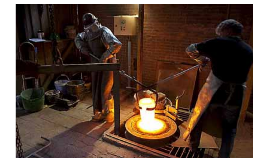
Het gevaarlijkste deel van het gietproces.