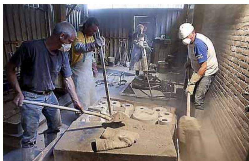
Gipsen 'eieren' in de zandbak

Bronsgieterij de Hooischoor aan Herenweg 160 in Oudorp houdt zaterdag 24 mei van 10 tot 13 uur een open dag. Er is dan een speciaal tarief voor bestellingen: twintig procent korting.